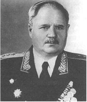
Болдин И. В. командарм Великой Отечественной войны, генерал-полковник