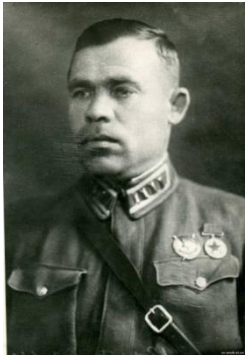
Мухин Г. В. советский военный деятель, генерал-майор